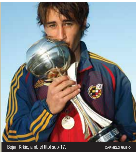
Bojan Krkić, amb el títol sub-17.