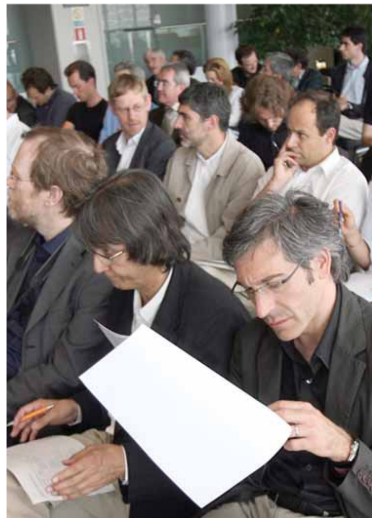
Una imatge de la trobada que es va fer a la sala de les Llotges Noves.

Per tal d'aconseguir que tothom gaudeixi de la mateixa informació, el club es compromet a enviar les dades de les respostes a tots els participants. ■