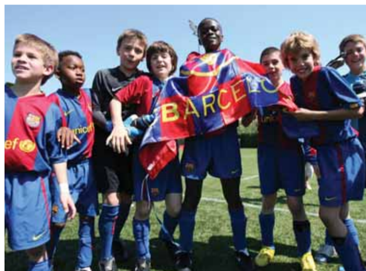
Els jugadors del benjamí A, celebrant el títol.