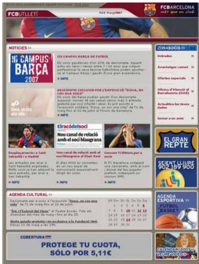
La nova imatge del butlletí electrònic.

També es pot fer trucant al 902 1899 00, per fax al 93 496 37 97, o es pot anar en persona a l'Oficina d'Atenció al Barcelonista (Camp Nou) i registrar o actualitzar les dades. ■