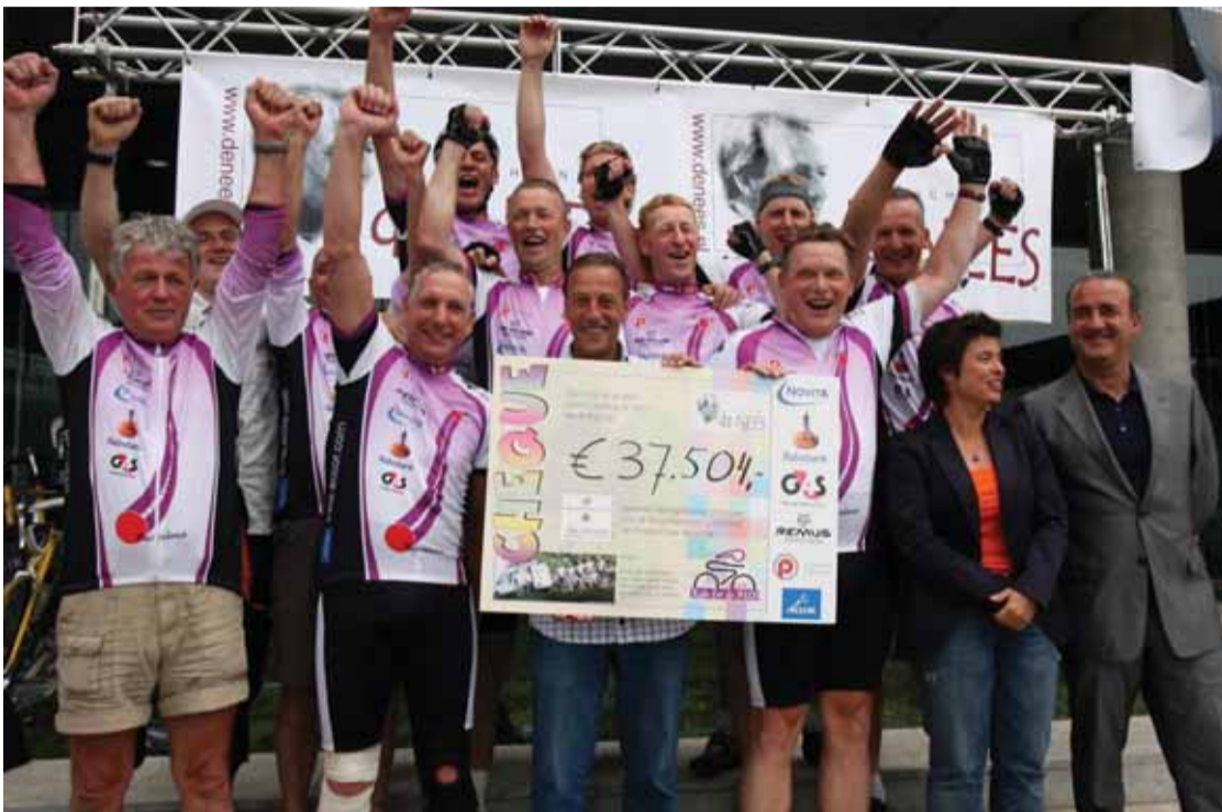
Els ciclistes i Johan Neeskens mostren orgullosos el taló amb els diners aconseguits per mitjà d'aquesta iniciativa.