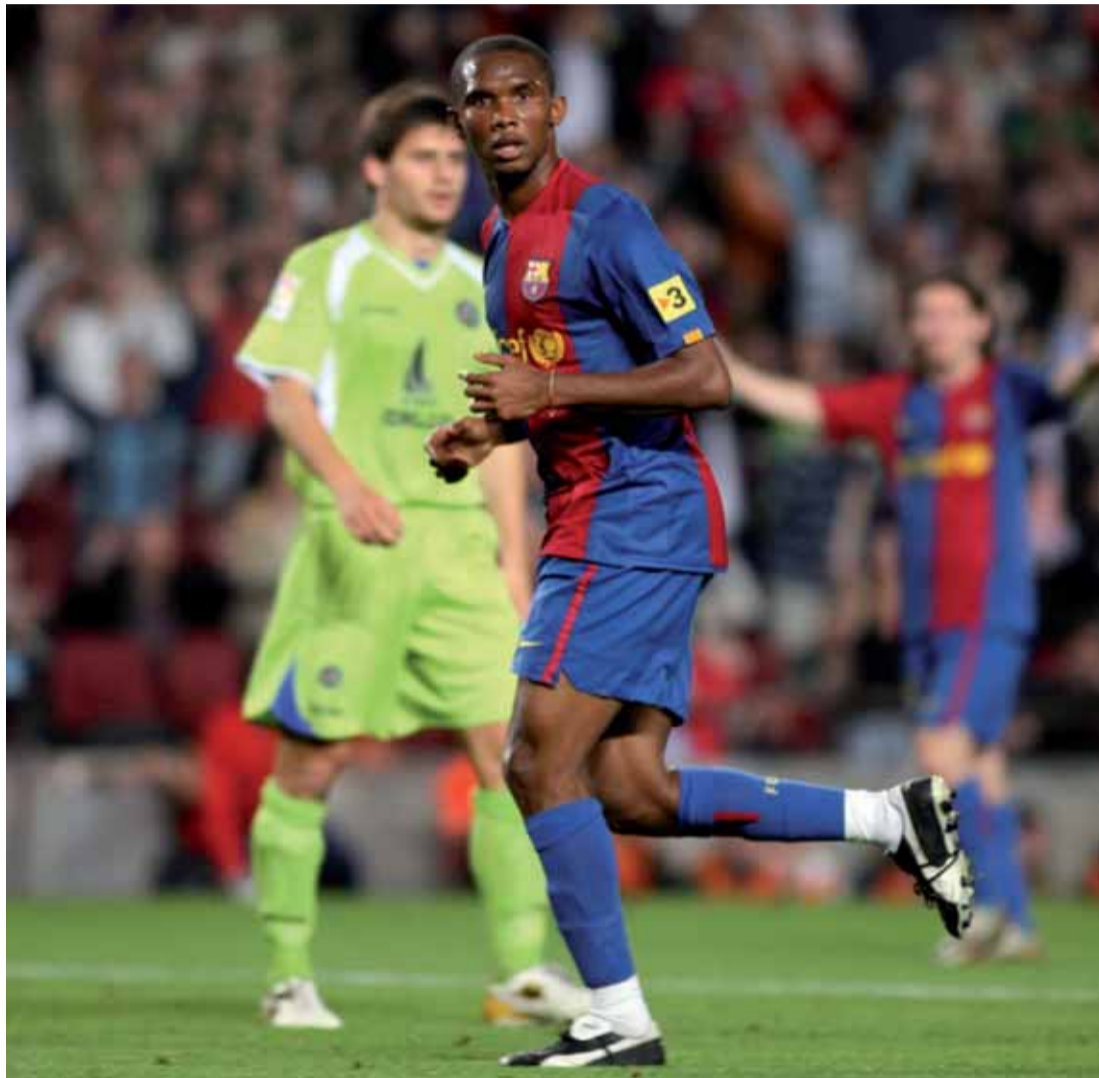
Eto'o, un dels que ha parlat davant dels mitjans de comunicació, celebrant el seu gol a l'anada de les semifinals de la Copa.

davant dels mitjans han deixat clara la unió i la confiança del grup. La visita del Getafe també està marcada novament pel partit que avui disputen el Reial Madrid i el Deportivo. Un triomf blanc posaria pressió al Barça, que, en l'últim matx, va demostrar que la suporta molt bé. Una ensopagada del líder comportaria una immillorable ocasió perquè l'actual campió recuperi la primera plaça, sempre que guanyi avui al Camp Nou, l'únic estadi que no ha vist una victòria visitant en tota la competició.