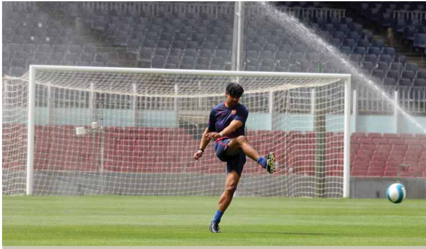
Frank Rijkaard, durant l'entrenament d'ahir al Camp Nou.

FRANK RIJKAARD DESTACA LA MENTALITAT DELS JUGADORS I LA UNIÓ DE L'EQUIP