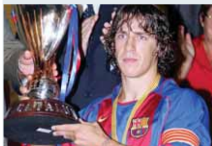
Puyol aixeca la Copa Catalunya. Setembre del 2005