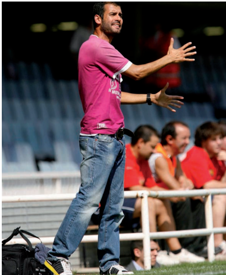
El Barça B de Guardiola, protagonista de les retransmissions.

Barça TV és, doncs, una finestra variada que mostra a temps real l'activitat de l'entitat, esportiva, social i institucional. L'aposta informativa ha crescut en les dues últimes temporades. Primer va ser la posada en marxa de dues finestres diàries d'actualitat, amb els programes Zona Mixta (13.30 h) i Barça Notícies (19.30 h), que, en franges horàries diferents, expliquen cada dia tot el que passa al Barça i converteixen totes les instal·lacions en un gran plató. Una vegada consolidada aquesta idea, aquesta temporada s'ha apostat de manera decidida pels directes i les retransmissions de partits. D'aquesta manera, s'emeten tots els partits del Barça B, una tria dels millors partits del futbol base cada cap de setmana i una selecció dels partits de les seccions professionals del club.