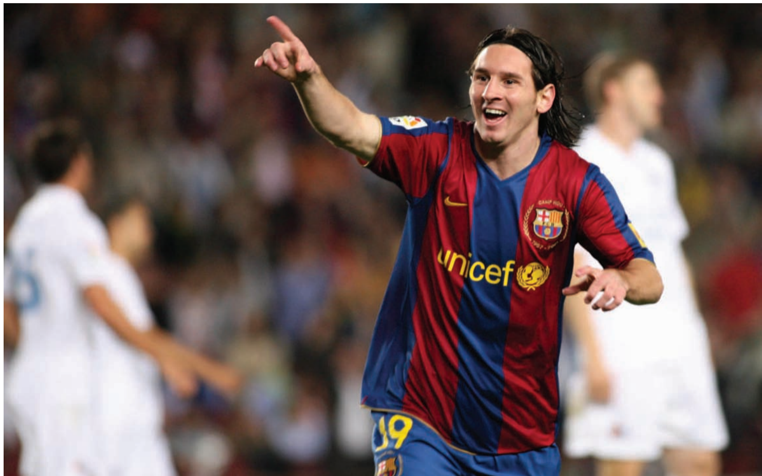
Leo Messi, ara lesionat, celebrant un dels nou gols anotats en Lliga.

EL BARÇA VOL DEDICAR LA VICTÒRIA AL CRAC ARGENTÍ