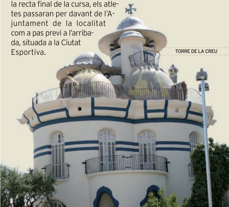
TORRE DE LA CREU

El recorregut també oferirà la possibilitat de passar per davant de la casa modernista de Can Negre, obra de l'arquitecte Josep Maria Jujol. Ja encarant la recta final de la cursa, els atletes passaran per davant de l'ajuntament de la localitat com a pas previ a l'arribada, situada a la Ciutat Esportiva.