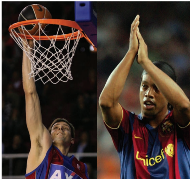
El diumenge 23 de març l'equip de futbol i el de bàsquet juguen a casa.

vacances tenen la possibilitat d'alliberar la seva localitat i així permetre a un altre barcelonista gaudir del partit contra el Valladolid. Des d'avui mateix, els socis poden fer ús del Seient