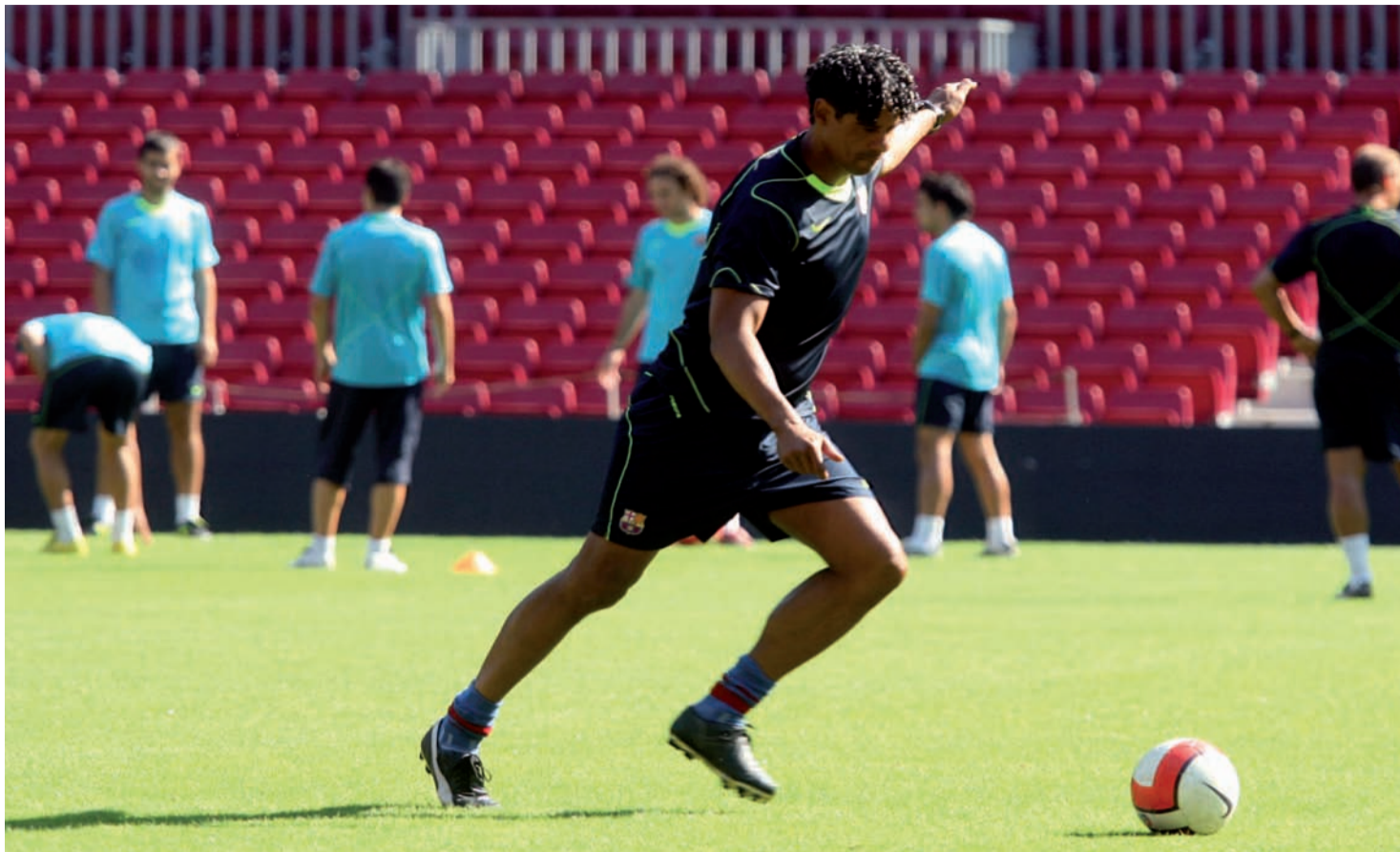
Rijkaard, en una sessió d'entrenament al Camp Nou.