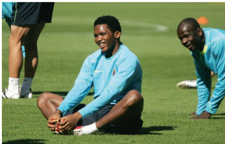
Samuel Eto'o es posa a punt per al Vila-real.

Serà el quart partit entre el Barça i el Vila-real aquesta temporada. Fins ara, un triomf groc (Lliga), un empat (Copa, anada) i una victòria blaugrana (Copa, tornada).